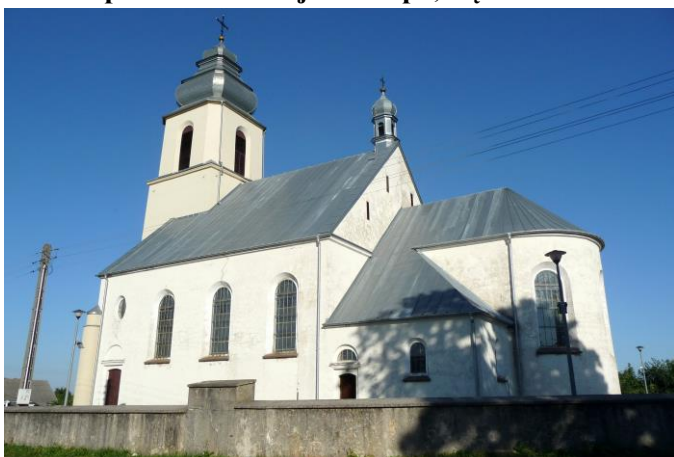
Zdjęcie nr 2. Kościół pw. Św. Mikołaja Biskupa, Dębno