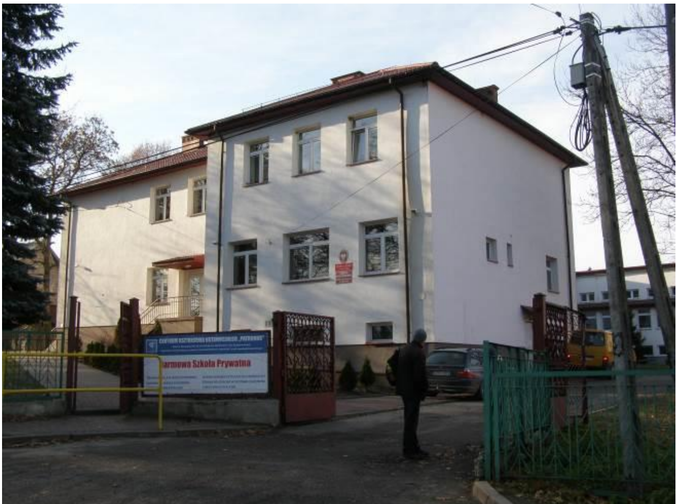
Zespół Szkół w Nowej Słupi

Placówki oświatowe dysponują obiektami wraz z wyposażeniem służącym prowadzeniu działalności edukacyjnej, wychowawczej i opiekuńczej. Corocznie podejmowane są działania inwestycyjne mające na celu podwyższenie jakości bazy edukacyjnej. Stan techniczny i funkcjonalność budynków oświatowych uznać należy za dobry, mimo iż każda placówka ma swoje lokalowe problemy.