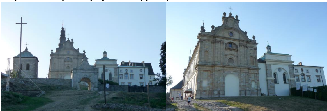
Zdjęcia nr 3, 4. Zespół klasztorny, Święty Krzyż

Zespół klasztorny benedyktynów obejmujący kościół pw. Trójcy Św., klasztor, dzwonnice, ogrodzenie z bramą i bramę wsch. oraz dawny szpital, położony jest nieco poniżej szczytu Łysej Góry, w kierunku płn.-wsch. Usytuowany w otwartej przestrzeni, dominuje nad okolicą, dookoła – puszcza jodłowa. Wzgórze opada stromym zboczem wsch. do Nowej Słupi, po którym wiedzie Droga Królewska, w górnej części wyłożona kamieniem. Ruch kołowy prowadzi od zach. Teren zespołu wrzecionowaty, wydłużony na linii wsch.-zach., częściowo naturalny, częściowo splantowany, otoczony jest murami oporowymi i ogrodzeniem z bramami. Zespół składa się z orientowanego kościoła – stanowiącego płd. zamknięcie prostokątnego wirydarza klasztornej i klasztoru – razem tworzących zamknięty czworobok zabudowań z krużgankami obiegającymi