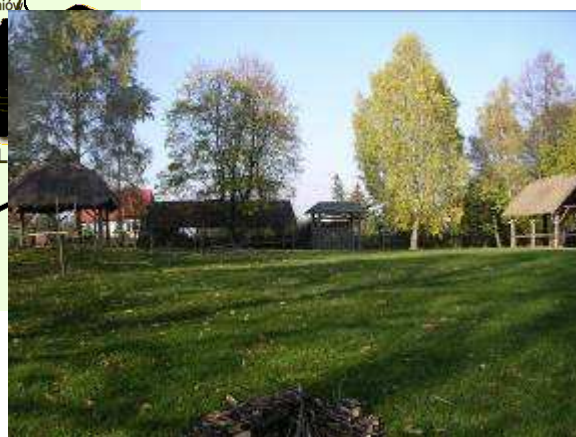
Teren „Dymarek Świętokrzyskich”