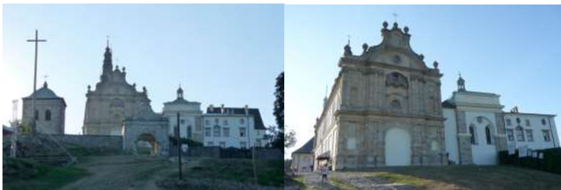
Zdjęcie nr 3, 4. Zespół klasztorny, Święty Krzyż

Zespół klasztorny benedyktynów obejmujący kościół pw. Trójcy Św., klasztor, dzwonnice, ogrodzenie z bramą i bramę wsch. oraz dawny szpital, położony jest nieco poniżej szczytu Łysej Góry, w kierunku półn. - wsch. Usytuowany w otwartej przestrzeni, dominuje nad okolicą, dookoła - puszcza jodłowa. Wzgórze opada stromym zboczem wsch. do Nowej Słupi, po którym wiedzie Droga Królewska, w górnej części wyłożona kamieniem. Ruch kołowy prowadzi od zach. Teren zespołu wrzecionowaty, wydłużony na linii wsch. - zach., częściowo naturalny, częściowo splantowany, otoczony jest murami oporowymi i ogrodzeniem z bramami. Zespół składa się z orientowanego kościoła - stanowiącego półd. zamknięcie prostokątnego wirydarza klasztornego i klasztoru - razem tworzących zamknięty czworobok zabudowań z krużgankami obiegającymi wirydarz; od zach. dwa skrzydła na rzucie litery L, które otaczają dziedziniec otwarty na półd. Na osi półn. skrzydła klasztoru - tzw. wielki ryzalit; między nim a bramą główną - obszerny plac gospodarczy otoczony wysokim, kamiennym murem. W półn. - zach. części założenia - budynek dawnego szpitala, przed nim rozległy, owalny plac - dawny dziedziniec więzienny. Obszar założenia określają mury oporowe, ogrodzenia i bramy. Brama główna - w części wsch. Między bramą a kościołem -