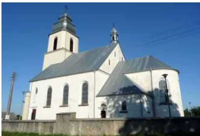
Zdjęcie nr 2. Kościół pw. Św. Mikołaja Biskupa, Dębno

Kościół wzniesiony został w 1936 r. na miejscu lokalizacji starszego kościoła. Na rzucie prostokąta z węższym, zamkniętym półkoliście prezbiterium ujętym parą prostokątnych aneksów i z pięciokondygnacyjną wieżą w fasadzie, częściowo wpuszczoną w mury korpusu. W narożach fasady - niskie cylindryczne wieżyczki, w szczycie dachu nawy - sygnaturka. Ściany murowane, tynkowane, dach kryty blachą.